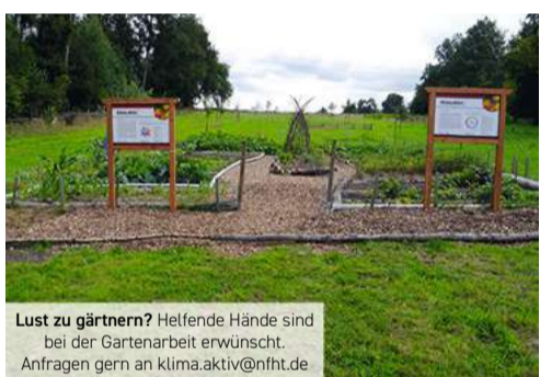
Lust zu gärtnern? Helfende Hände sind bei der Gartenarbeit erwünscht. Anfragen gern an klima.aktiv@nfht.de

Der Permakultur Garten bildet das Herzstück unseres Projekts Klima.Aktiv: nachhaltig und gesund leben, Natur erfahren, Permakultur und Klimaschutz - Wildnis, Biotop, Nutzfläche - vieles wird im NaturGarten anschaulich und erfahrbar. Gefördert wird „Klima.Aktiv“ durch die Stiftung Umwelt und Entwicklung Nordrhein-Westfalen. Ein Hektar Wiese, ehemals Schafweide, wird in einen produktiven Lebensraum mit vielfältigen Nutzungsmöglichkeiten umgestaltet: unter anderem als Gemüsegarten, Lebensraum für Wildtiere, als Ort für Freizeitgestaltung und Wissensvermittlung. Bei Planung und Umsetzung richten wir uns nach den Grundlagen und Prinzipien der Permakultur. Der Begriff „Permakultur“ setzt sich zusammen aus den englischen Begriffen „permanent“ und „(agri)culture“. Sinngemäß übersetzt beschreibt er eine auf Nachhaltigkeit ausgerichtete Lebensweise. Ursprünglich für die Gestaltung von Gärten oder landwirtschaftlichen Flächen entwickelt, können die Prinzipien der Permakultur auf alle Lebensbereiche angewendet werden. Ziel ist die Gestaltung von Systemen, welche vielseitig nutzbar und langfristig ertragreich sind und gleichzeitig wertvollen Lebensraum für eine Vielzahl von Lebewesen erhalten.